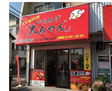
からあげ大ちゃん