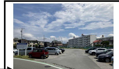
駐車場③(芝浦C駐車場)

駐車場①は65台分しか駐車スペースがないため、すぐに満車となります。8:50以降のご来校の方は予め駐車場②へお願いします。