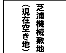
芝浦機械敷地 (現在空き地)