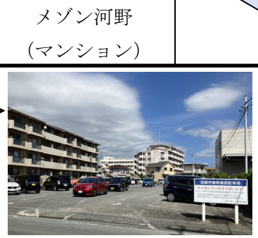
駐車場①(教職員駐車場)