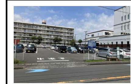
駐車場②(芝浦A・B駐車場)